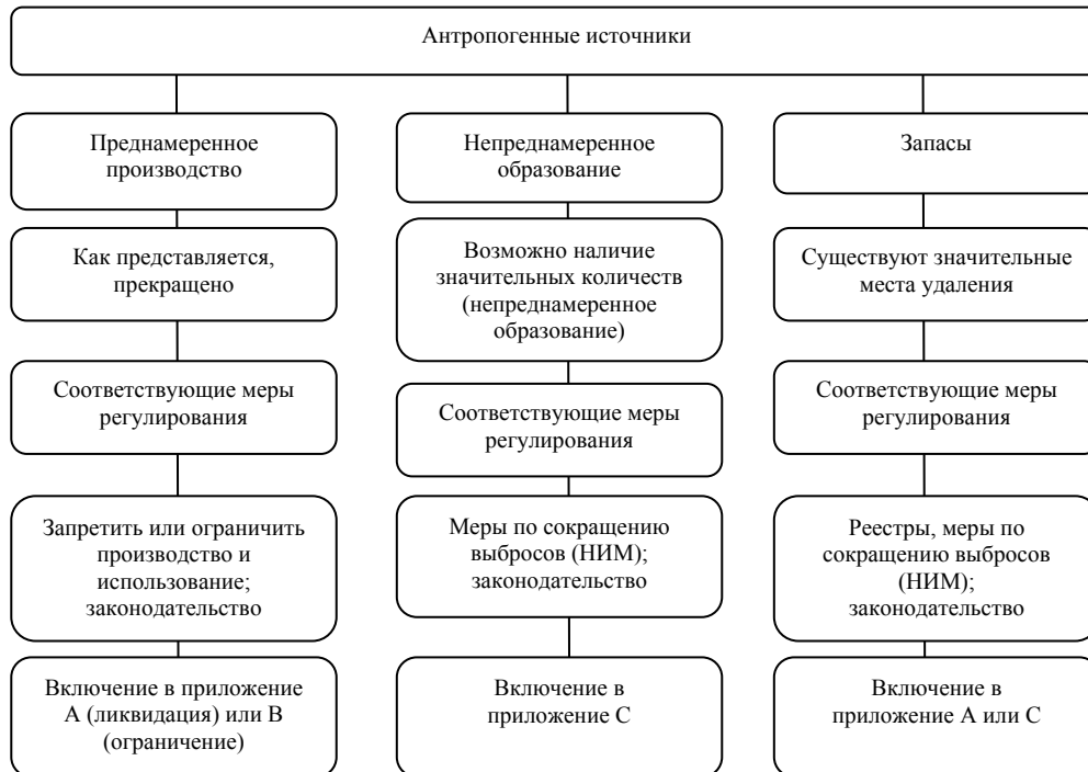
Рис. 1: Соответствующие источники и возможные меры регулирования ГХБД

46. Возможные меры могут быть направлены на соответствующие антропогенные источники ГХБД: 1) преднамеренное производство, 2) непреднамеренное образование и 3) запасы. На Рис. 1 показаны соответствующие источники и возможные меры регулирования ГХБД.